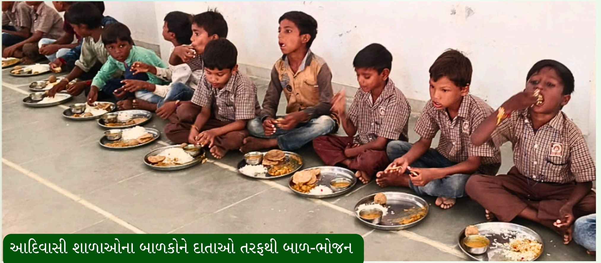
આદિવાસી શાળાઓના બાળકોને દાતાઓ તરફથી બાળ-ભોજન